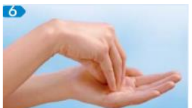
Kreisendes Reiben mit geschlossenen Fingerkuppen der rechten Hand in der linken Handfläche - & umgekehrt