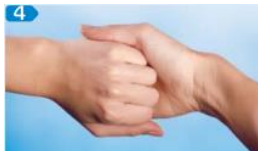
Aussenseite der verschränkten Finger auf gegenüberliegende Handflächen