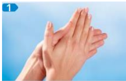
Handfläche auf Handfläche einreiben

Für die richtige Anwendung des Desinfektionsmittels, sollten Ihre Hände gewaschen und trocken sein. Halten Sie Ihre Hand hohl und entnehmen Sie mit dem Unterarm das Desinfektionsmittel. Als nächstes sollten Sie die aufgezeichneten 6 Schritte, 30 Sekunden lang ausführen. Ihre Hände müssen die gesamte Einreibezeit feucht bleiben, ansonsten erneut Händedesinfektionsmittel entnehmen.