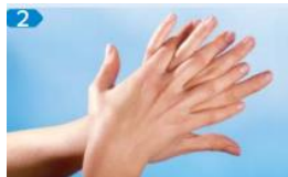
Rechte Handfläche über linken Handrücken – und umgekehrt