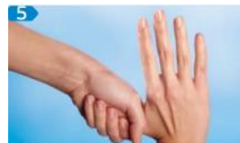
Kreisendes Reiben des rechten Daumens in der geschlossenen linken Handflächen - & umgekehrt