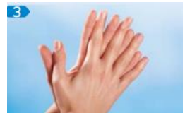
Handfläche auf Handfläche mit verschränkten, gespreizten Fingern