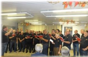
Männerchor am Etzel